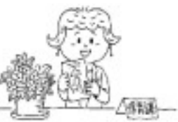
田原本町議会議員